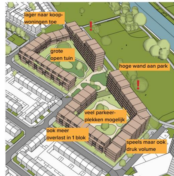
Model 3 - Gekoppeld blok